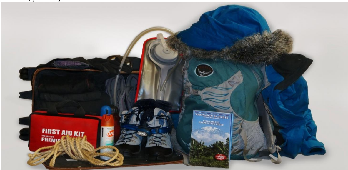
En del af Karsten Ree Holding

Tanzania ligger lige syd for Ækvator. Solen er derfor meget hård ved vores sarte danske hud og derfor anbefales en solcreme med en høj faktor. Faktor 30-50 er passende for mange. Undgå for megen direkte sol i timerne midt på dagen. Klimaet er tropisk med høj luftfugtighed ved kysten, hvor en frisk brise fra havet ofte lufter behageligt. I safariområderne inde i landet er klimaet mere tørt og varmen føles behagelig for de fleste. Dagtemperaturer på omkring 25-30 grader inde i landet er normalt, men morgenerne, hvor man kører safari kan være kølige. Temperaturen varierer i forhold til de områder man befinder sig i. Ophold i højlandet er en del køligere, ned til 2-5 grader om natten. Det kan derfor være en god idé at medbringe en fleecetrøje eller jakke.